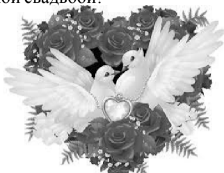
Родители и дети.

Пусть же счастливы будете вы, Никогда не теряйте любви. Пусть в семье будет мир и уют, Дети радость и помощь несут.